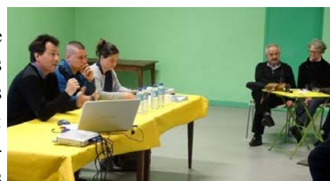
Intervention lors du café citoyen de Clermont le Fort

A la demande de l'association « La Sauce aux idées » de Clermont le Fort, la cellule animation Natura 2000 est venue présenter, le 3 mars 2017, le site Natura 2000 'rivière Ariège' et les réalisations faites dans le cadre des contrats forestiers signés avec le Sicoval sur ce territoire : restauration de ripisylve sur des plages dégradées, lutte contre des espèces végétales invasives et mise en défens de certaines zones fragiles par pose de barrières et de gradines.