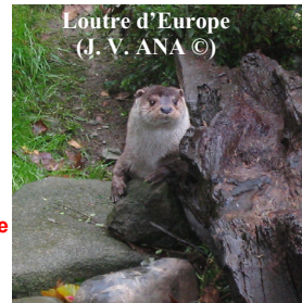
Loutre d'Europe

16 habitats naturels ont été référencés : la végétation du lit de la rivière, les lisières humides à grandes herbes et les forêts alluviales (photo ci-contre) figurent parmi les plus importants au regard de la Directive Habitats.