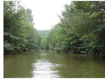
Forêt alluviale

16 habitats naturels ont été référencés : la végétation du lit de la rivière, les lisières humides à grandes herbes et les forêts alluviales (photo ci-contre) figurent parmi les plus importants au regard de la Directive Habitats.