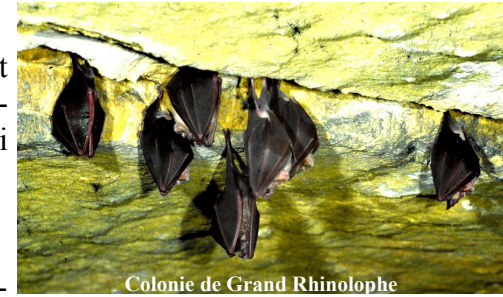
Colonie de Grand Rhinolophe

Il a été proposé une information générale sur la présence d'un environnement riche en habitats naturels et en espèces remarquables (comme les chauves-souris, photo ci-contre), avec la mise en place de sentiers écotouristiques ainsi qu'un programme de sensibilisation éducatif.