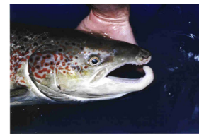
Saumon atlantique