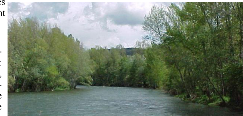
L'Ariège vers Varilhes

Pour chaque type d'actions des cofinancements pourront être proposés entre les partenaires suivants : Agence de l'Eau Adour-Garonne, Collectivités locales, Conseils Généraux, Conseils Régionaux, Conseil Supérieur de la Pêche (C.S.P.), Etat (Fonds du Ministère de l'Écologie et du Développement Durable) et Europe (FEADER : Fonds Européen Agricole pour le Développement Rural).