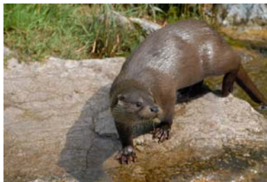
Loutre d'Europe (A. Bertrand ©)