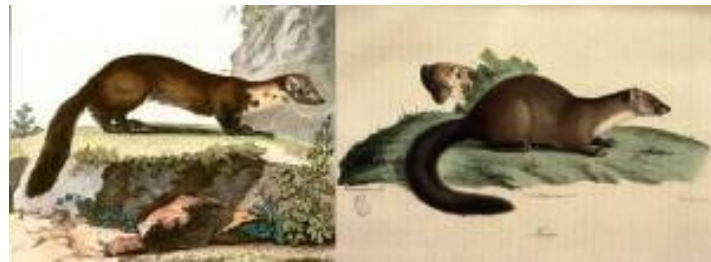
Fouine – Martre ( www.pratique.fr )