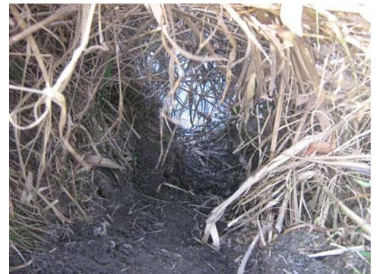
Coulée de loutre (Botaurus stellaris ©)