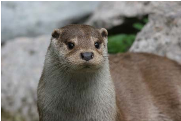
Loutre d'Europe

Carnivore qui appartient à la sous-famille des Lutrinae de la famille des Mustelidae