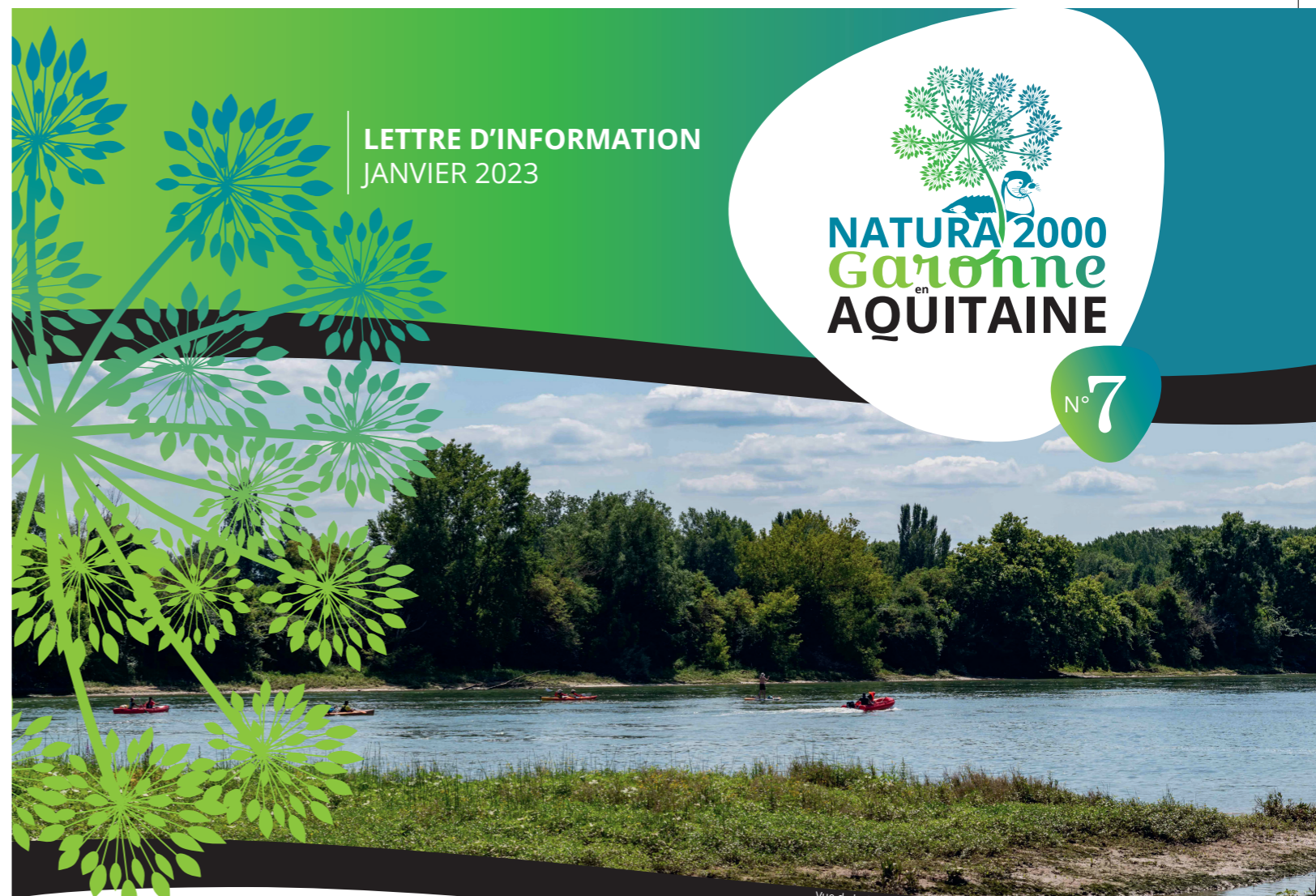
Vue de la Garonne depuis le port de Saint-Macaire (33)

www.tempora.com et service de communication SMEAG