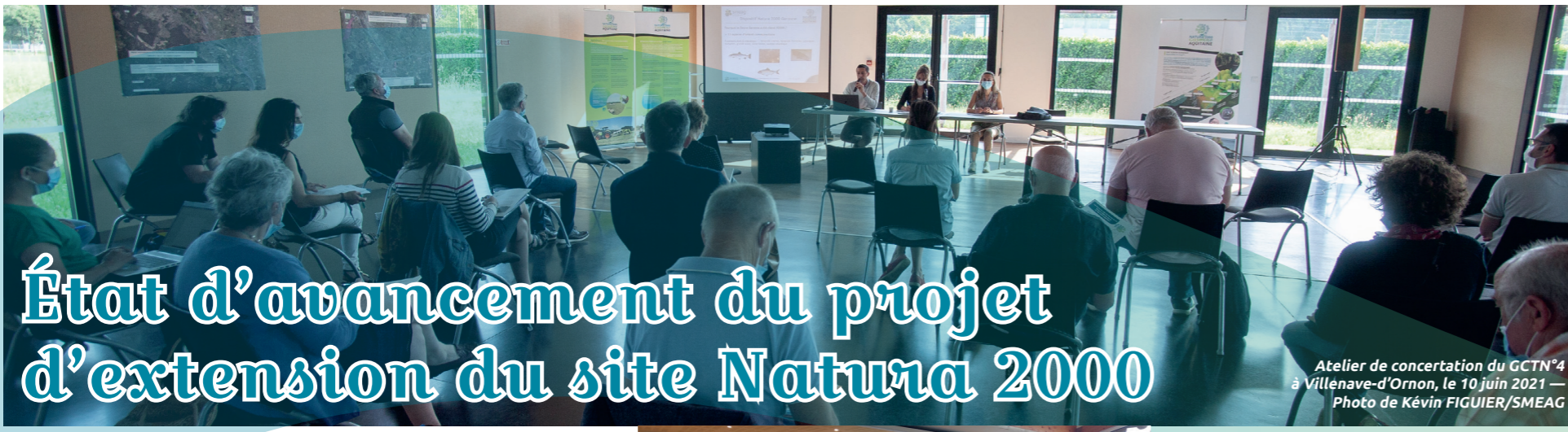
Atelier de concertation du GCTN 4 à Villenave-d'Ornon, le 10 juin 2021