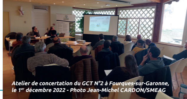
Atelier de concertation du GCT N°2 à Fourques-sur-Garonne, le 1 er décembre 2022

L'animation du site Natura 2000 "Garonne en Nouvelle-Aquitaine" a été initiée suite à la validation de son Document d'Objectifs (DOCOB) et de son périmètre en novembre 2013. De la commune Lot-et-Garonnaise de Saint-Sixte jusqu'au bec d'Ambès en Gironde, le site Natura 2000 représente 250 km de cours d'eau et une surface de 6 684 ha, principalement situé en lit mineur et en berges du fleuve.