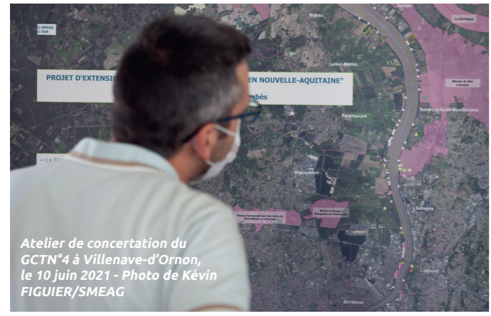
Atelier de concertation du GCTN 4 à Villenave-d'Ornon, le 10 juin 2021

De même pour les Chartes Natura 2000, l'un des leviers d'actions pour motiver les signataires à s'engager est l'exonération de la taxe foncière sur les propriétés non bâties (TFPNB) sur les parcelles incluses dans le périmètre N2000. Par conséquent, très peu de personnes peuvent en bénéficier aujourd'hui en raison du faible nombre de parcelles incluses sous le périmètre actuel. De plus, la révision du périmètre était prévue dès l'élaboration du DOCOB. En effet, l'une des fiches actions vise à intégrer les zones humides d'intérêt communautaire du lit majeur dans le périmètre actuel du site. Afin de concilier les objectifs de cette fiche action et donner la possibilité aux acteurs du territoire de s'investir dans la restauration écologique des bords de Garonne, le SMEAG a lancé dès 2019 ce projet d'extension. Depuis, un important travail technique cartographique intégrant les enjeux écologiques de Garonne et des concertations territorialisées ont été menés sur tout le long du linéaire de Garonne en Nouvelle-Aquitaine.