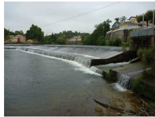
Barrage de Saverdun