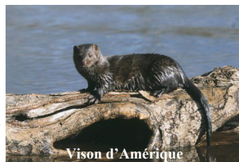
Vison d'Amérique

Peu de données sont disponibles actuellement d'où la proposition de mettre à disposition des acteurs de terrain, une enquête « vison » afin de déterminer sa zone de répartition. Vous pouvez télécharger l'enquête sur le site internet Natura 2000 ou vous adresser aux contacts mentionnés page 4.