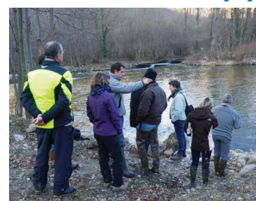
Visite de terrain pour l'observation des épreintes de loutre sur les berges de l'Ariège

Durant l'année 2011, une étude de suivi des populations de loutre sur les axes Ariège, Hers vif et Salat, a été menée dans le cadre de l'animation Natura 2000. En effet, la loutre est une espèce dont la dynamique est importante sur le département de l'Ariège. Les phases initiales d'inventaires ont été réalisées durant la phase d'élaboration des DOCOBs entre 2004 et 2006-2007 et cette étude faisait l'objet d'une fiche action dans chacun des 3 DOCOBs.