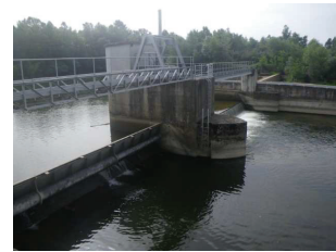
Barrage de Pébernat