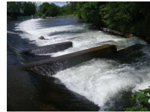
Barrage de Guilhot