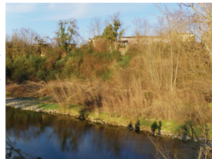
Un des îlots de Bonnac qui sera traité en 2012 par le SYRRPA

Une consultation multipartenariale entre les syndicats de rivière, la cellule animation (comprenant les naturalistes) et les services de l'État avait été proposée lors de l'élaboration du DOCOB, à l'occasion de la mise en place de travaux en rivière. Une rencontre a eu lieu, dans le courant de l'année 2011, avec chacun des techniciens des 3 syndicats présents sur le linéaire de l'Ariège : le SYRRPA (Syndicat Mixte de Restauration des Rivières de la Plaine d'Ariège), la communauté de communes du Pays de Foix et le SMAHVAV (Syndicat Mixte d'Aménagement de la Haute Vallée de l'Ariège et du Vicdessos).