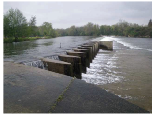
Barrage du moulin de la ville à Auterive—ECOGEA ©

L'axe Ariège accueille le saumon atlantique à différents stades de son cycle biologique : des jeunes individus sont déversés dans le milieu naturel et les adultes remontent s'y reproduire. L'enjeu de la libre circulation (montaison/dévalaison) a été listé comme prioritaire dans le DOCOB. C'est pourquoi, une expertise complète de l'ensemble des ouvrages hydroélectriques localisés en aval de Labarre (limite amont d'accessibilité sur l'axe Ariège) pour la libre circulation des espèces piscicoles a été réalisée entre 2009 et 2010 par le bureau d'études ECOGEA . La restitution a eu lieu en septembre 2011 et ce rapport permettra d'avoir un document de référence sur cet axe.