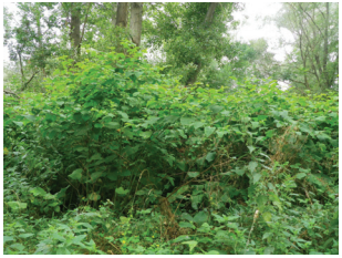
Renouée du Japon