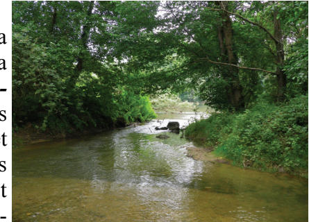
Un bras de l'Ariège à Lacroix-Falgarde

La démarche Natura 2000 est basée sur la concertation et pour faciliter sa mise en œuvre, un découpage en entités a été réalisé. Pour chaque entité, la première phase de travail consiste en l'élaboration d'un Document d'Objets (DOCOB) , document de gestion de ces sites comprenant un état des lieux (écologique et des activités humaines), l'identification des enjeux et des propositions d'actions discutées en groupes de travail. Une fois les DOCOBs validés, en 2006 pour l'entité Ariège, une seconde phase se met alors en place : l'animation . Elle a pour objectif de mettre en œuvre les actions inscrites dans les DOCOBs, ce qui représente une soixantaine de propositions d'actions pour l'Ariège.