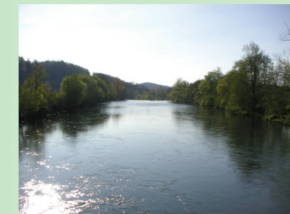
Le Salat à Mazères