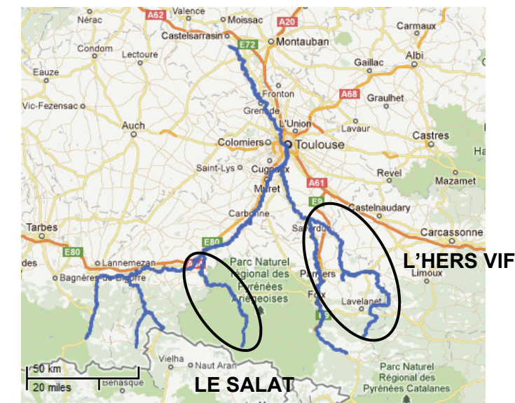
Représentation du site « Garonne, Ariège, Hers, Salat, Pique et Neste »

C'est un outil de gestion résultant d'une concertation locale entre tous les partenaires du territoire concerné, notamment les acteurs locaux (pêcheurs, agriculteurs, producteurs d'électricité, association de protection de l'environnement, collectivités territoriales...).