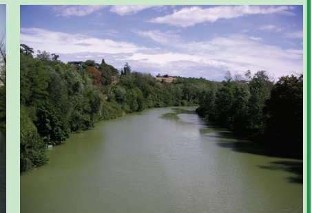
L'Hers à Cintegabelle