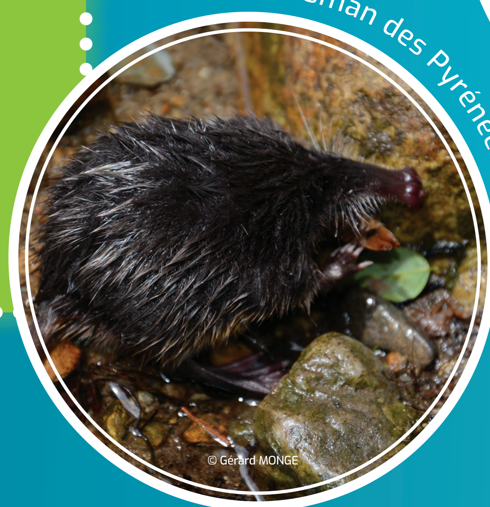
|| Desman des Pyrénées