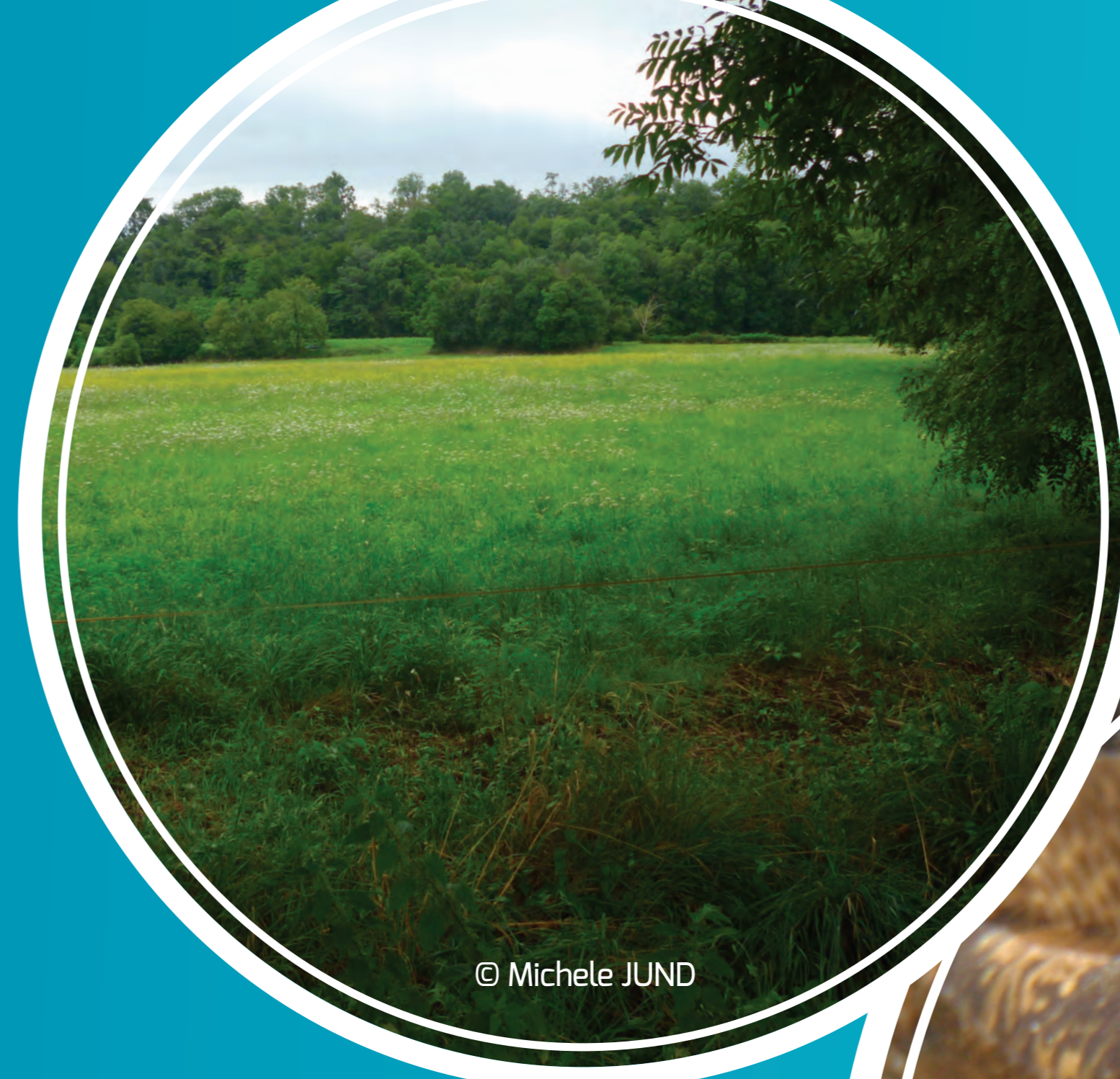
|| Prairie de fauche

Les prairies maigres de fauche jouent un rôle prépondérant avec une diversité floristique pouvant atteindre 60 espèces de plantes par parcelle ! Élément de la mosaïque fluviale, elles attirent de nombreux insectes, constituant un réservoir de biodiversité et un début de chaîne alimentaire variée. Le maintien de ces prairies et leur entretien sans apport de fertilisant est une priorité.