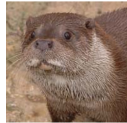
Loutre d'Europe

Les inventaires sur les activités humaines seront complétés lors des groupes de travail. Des prospections supplémentaires sur le terrain cet été permettront de terminer les inventaires naturalistes sur les habitats naturels en lit majeur et sur les espèces suivantes : la loutre d'Europe, le desman des Pyrénées, les chauves-souris et quelques insectes (libellules, lucane ...).