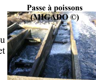
Passe à poissons

Les projets en cours vont être rediscutés en groupes de travail avant validation et montage des dossiers de subvention.